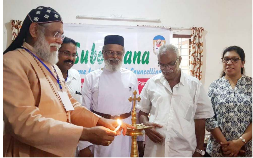
"Subodhana" annually conducted training camp for heads of Schools under C&MD Management for 2019 was inaugurated this morning (Apr. 25, 2019) at "Samanvaya" Study Center, Pampakuda.

ഏപ്രിൽ 25-ന് പള്ളിയിൽ എത്തിയ റിസീവർ ഇരു ഭാഗവുമായി ചർച്ച നടത്തി. ഇനി മുതൽ സുപ്രീം കോടതി വിധി അനുസരിച്ചു മാത്രമേ ആരാധനാ ക്രമീകരിക്കുവാൻ സാധിക്കുകയുള്ളൂ എന്നും, പാരലൽ അഡ്മിനിസ്ട്രേഷൻ പാടില്ല എന്നും അദ്ദേഹം അറിയിച്ചു.