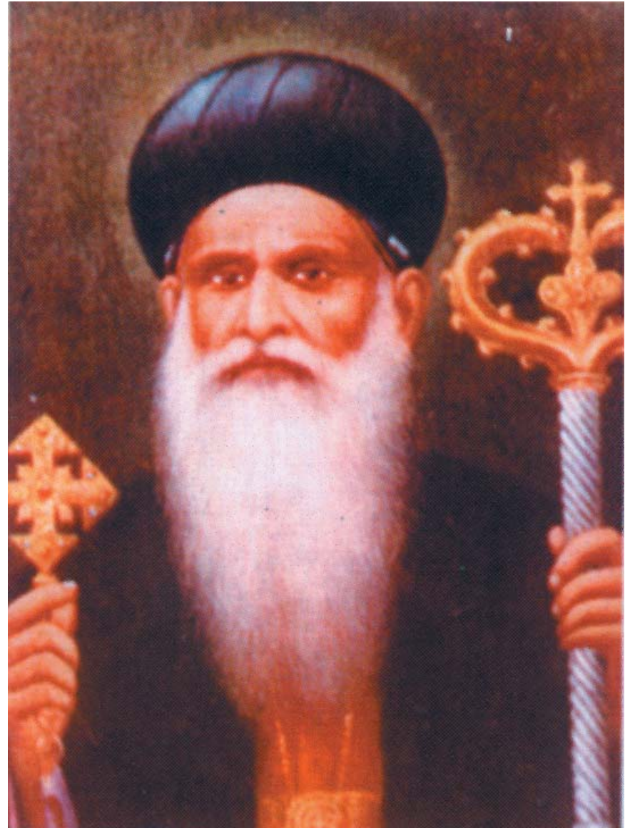
ഓർമ്മ മെയ് 3-ന് പാമ്പാക്കൂട ചെറിയപള്ളിയിൽ

1902-ൽ പ: പരുമല തിരുമേനിയുടെ കന്വീല, കബറടക്കം എന്നിവയ്ക്ക്