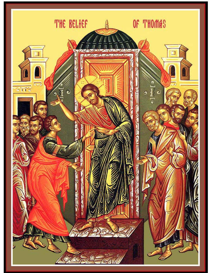
Icon-The Belief of St Thomas

Eight days later, Jesus Christ appeared again to all disciples. Our Lord exhorted St Thomas to believe the resurrection by putting his finger in His nails and to touch His side by his hand. There was no looking back for St Thomas. Overcome with love and devotion, he uttered the most beautiful and insightful proclamation: ‘My Lord and My God’!